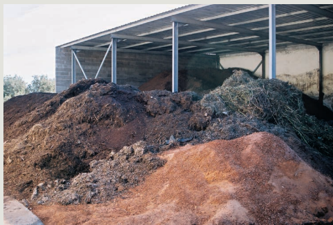
Mistura de materiais

ria da estrutura; ii) aumento do arejamento; iii) retenção de água em solos arenosos; iv) maior absorção dos raios solares devido à cor escura e o consequente aumento de temperatura e v) fornecimento gradual de nutrientes às culturas.