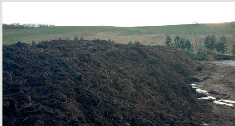
Pilha de compostagem

A utilização de compostos orgânicos tem ainda os benefícios inerentes à incorporação de matéria orgânica no solo: i) melho-