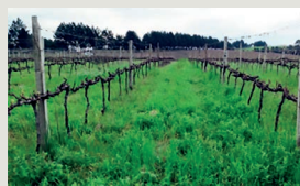
Figura 3 – Enrelvamento com Vicia sativa + Avena sativa na vinha

porque o N é exportado anualmente pelos cachos de uva e lenha de poda, devendo