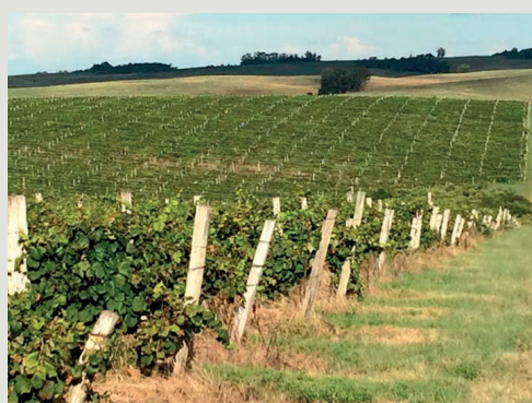
Figura 1 – Aspeto da vinha 'Cabernet Sauvignon' no Sul do Brasil

de N e o tipo de fertilizante afetam o estado nutritivo da planta, a produtividade e as características da uva. Na cultivar Cabernet Sauvignon cultivada em solo arenoso, com baixo teor de matéria orgânica, mas com revestimento incluindo leguminosas em toda a área de vinha, verificou-se que a adição de 15 kg N ha -1 na forma mineral foi adequada para as plantas em produção (Quadro 1). Além disso, a fertilização orgânica revelou-se adequada para o fornecimento de N à vinha. A maior parte do N do fertilizante aplicado durante o ano à 'Cabernet Sauvignon' foi acumulado nos órgãos anuais da videira