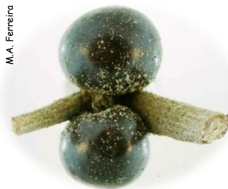
Fêmeas de K. ilicis

K. vermilio pode confundir-se com outra espécie do mesmo género, K. ilicis , identificada em Portugal em sobreiro e carrasco, devido a partilharem os mesmos hospedeiros e terem aspecto semelhante. A identificação exige observação ao microscópio de determinadas características morfológicas, havendo, no entanto, algumas particularidades, facilmente observáveis, que podem dar indicações para a sua distinção. As fêmeas adultas são globóides, a de K. vermilio de tom castanho avermelhado, coberta por uma pruína branca, abundante e fina, e a de K. ilicis de cor negra brilhante, com uma muito tênue pruína branca. Os ovos e as larvas de K. vermilio são de coloração carmesim, enquanto os de K. ilicis são mais claros, mesmo esbranquiçados. As larvas masculinas de K. ilicis , ao contrário das de K. vermilio , não mostram preferência pelas folhas, podendo ser encontradas nos troncos.