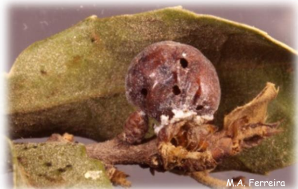
Fêmea de K. vermilio parasitada

As causas da sua raridade actual são desconhecidas, podendo haver, no entanto, algumas explicações possíveis, conjugadas e interdependentes, como as alterações climáticas, a utilização prolongada do carrasco como combustível, a fragilidade das larvas neonatas e o longo período de hibernação, o parasitismo, devido a forte actividade de parasitóides, e a predação.