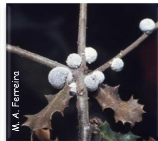
Fêmeas de K. vermilio