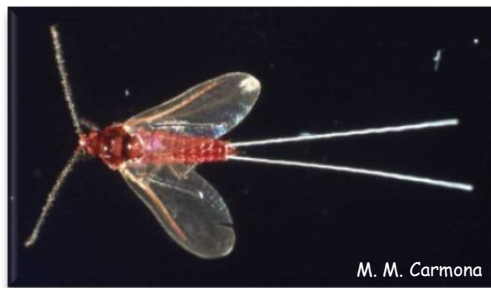
Macho de K. vermilio

A fêmea adulta, fixa, tem forma esférica, assemelhando-se a um grão, daí a designação de grã, podendo atingir, por vezes, quase 1 cm de diâmetro. A sua carapaça, inicialmente de consistência fraca e coberta por uma pruína ou pó branco, endurece, depois, perde a pruína e adquire um tom castanho avermelhado característico.