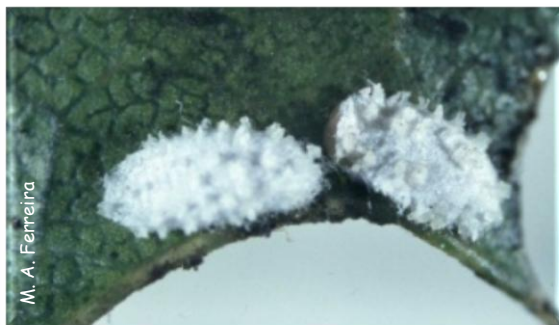
Pupários de machos de K. vermilio

A larva de 2.º instar (fêmea) é vermelha, fixa, arredondada, com o corpo coberto por cones de cera branca, que caem posteriormente.