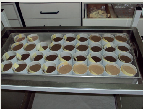
Amostras prontas para análise

mação relativa aos laboratórios de análise de terra onde se poderá dirigir quem estiver interessado em analisar a sua terra para estabelecer um plano de fertilização. O levantamento desta informação foi feito com base no conhecimento dos autores sobre o tema, confirmado pelo envio de um inquérito aos responsáveis de 34 laboratórios de análise de terra a operar no nosso País. A esse inquérito responderam 21 laboratórios.