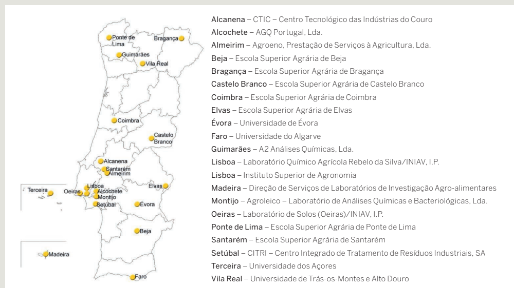
Localização dos laboratórios de análises de terra em Portugal