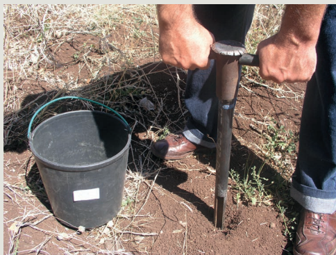
Colheita da amostras de terra

De facto, alguns laboratórios estão mais direcionados para a análise de potenciais elementos contaminantes e de parâmetros decorrentes da legislação ambiental (Dec. Lei n.º 276/2009 – Lei das lamas, por ex.). Noutros, ainda, o tipo de análises de terra está mais ligado à geotecnia, ou à geologia. Neste trabalho, reforçamos, reúne-se infor-