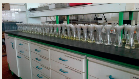
Extratos prontos para análise de fósforo e potássio

Existe uma relativa homogeneidade de métodos analíticos entre os laboratórios de