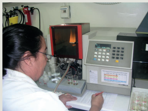
LAS – EAA