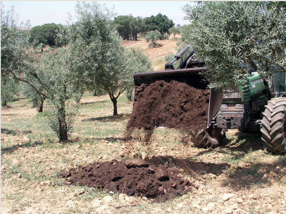
Figura 2 – Aspeto da distribuição do bagaço de azeitona

O método direto de elevar os teores da MO do solo é a aplicação, através do espalhamento e incorporação no horizonte superficial, de estrumes e/ou outras matérias orgânicas (lamas de ETAR, compostados de várias fontes, farinha de carne e ossos, bagaço de azeitona e outros), de forma periódica. O conhecimento das características dos materiais aplicados bem como as do solo recetor poderão confirmar os objetivos previstos.