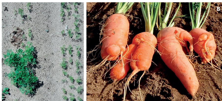
Figura 4 – Cultura da cenoura afetada por nemátode das galhas radiculares, Meloidogyne sp. A – Redução do desenvolvimento da parte aérea das plantas; B – Deformações da cenoura à colheita

critérios aplicados, poderá conduzir a desequilíbrios nos organismos do solo, com grave impacto a médio e longo prazo no ambiente e na saúde dos agricultores e consumidores. Pelo contrário, uma adequada nutrição e a manutenção do bom equilíbrio do solo irão conduzir à obtenção de plantas mais vigorosas e com maior capacidade de resistência ao ataque de agentes patogénicos. Por exemplo, a adição de matéria orgânica ao solo poderá contribuir para o incremento das populações de microrganismos benéficos (fungos e bactérias) e das populações de nemátodes predadores que atuarão como inimigos naturais de nemátodes fitoparasitas. Métodos de luta biológicos, como o recurso a fungos e bactérias capazes de eliminar os NGR, são linhas de investigação em curso em ambos os laboratórios referidos. A rotação com culturas não hospedeiras também constitui uma alternativa à apli-