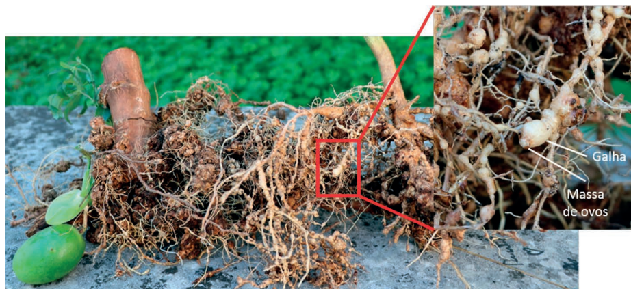
Figura 3 – Raízes de maracujá, Passiflora sp., infetadas com o nemátode das galhas radiculares, Meloidogyne sp.