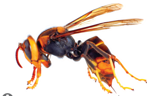
A VESPA VELUTINA OU ASIÁTICA