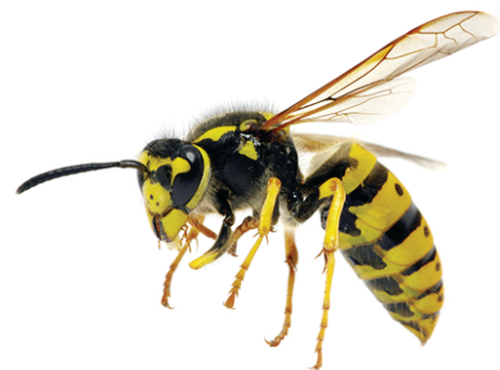
B VESPA GERMÂNICA

A vespa velutina entrou na Europa através de plantas envasadas originárias da Ásia. Chegou a Portugal continental através da importação de madeiras de Espanha.