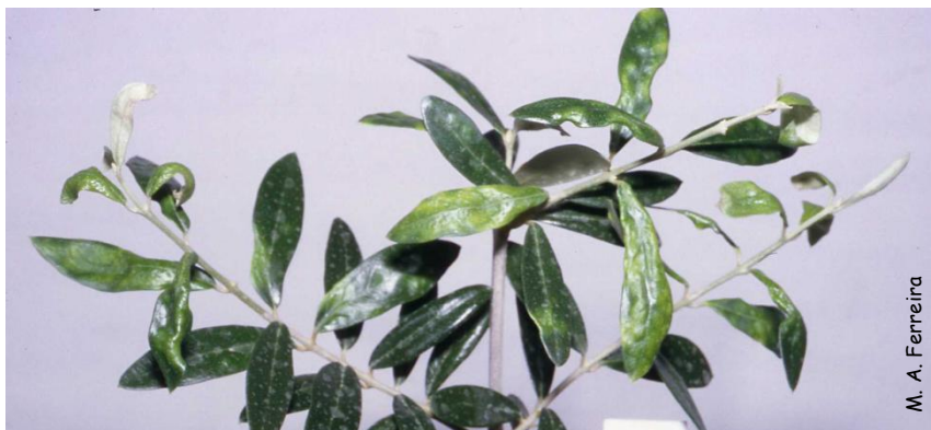
Sintomas de Aceria oleae em planta de viveiro.

É comum verificar-se a ocorrência de populações mistas de eriofídeos das várias espécies, com hábitos alimentares semelhantes, o que torna difícil avaliar a natureza e importância dos estragos por cada uma individualmente.