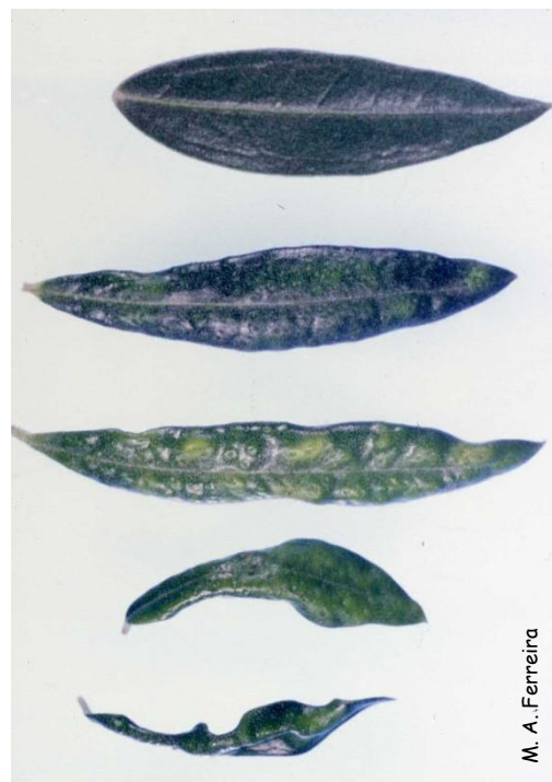
Folha sã (superior) e folhas com deformações devidas a Aceria oleae .