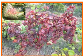
Fig. 1 - Videira infetada pela FD

A doença da Flavescência dourada da videira (FD) é provocada por um fitoplasma designado com o mesmo nome 'Grapevine Flavescence dorée phytoplasma'. Foi recentemente introduzida em Portugal (Sousa et al. , 2003, 2009) onde tem vindo a causar graves prejuízos na vinha (Fig.1).