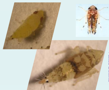
Fig. 4 - Ninfas e adulto de ST

Recentemente outros insetos são indicados como possíveis vetores da FD como Dictyophara europaea (Fillipin et al. , 2009) e Orientus ishidae (Mehle et al. , 2010).