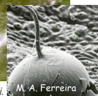
Ovo de P. citri eclodido.