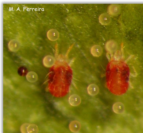
Fêmeas e ovos de T. cinnabarinus .