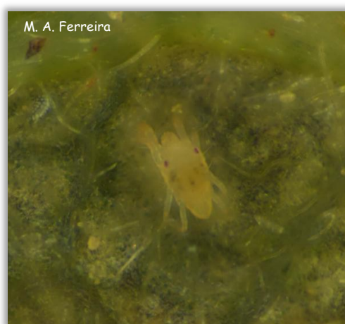
Macho de T. urticae .