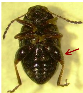
Fêmures posteriores muito desenvolvidos