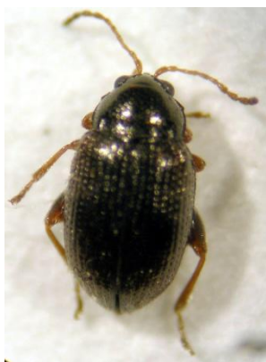
Adulto de E. similaris

• Coleóptero pequeno (1,7 - 2mm), negro, oval, convexo. • Antenas e patas mais claras do que o resto do corpo. • Antenas filiformes com 11 segmentos. • Fêmures posteriores dilatados. • Tarsos aparentemente com 4 segmentos, na realidade com 5 segmentos (criptopentâmeros) encontrando-se o quarto, muito pequeno, alojado nos lobos do terceiro. • Élitros com pontuações dispostas em estrias longitudinais e pubescentes, com pêlos curtos e brancos. • Pronotum com pontuações.