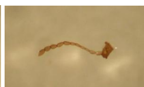
Antena com 11 segmentos

Para mais informações sobre E. similaris consultar o Boletim Técnico BT / 04, disponível em www.inrb.pt