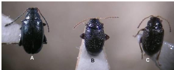
Phyllotreta atra (A), Epitrix similaris (B) e Epitrix cucumeris (C)

A distinção entre E. similaris e E. cucumeris requer a preparação e observação de órgãos do aparelho reprodutor no laboratório (espermateca e aedeagus). Em caso de dúvida enviar os exemplares para: UIPP • Tapada da Ajuda, Edifício 1 • 1349-018 Lisboa