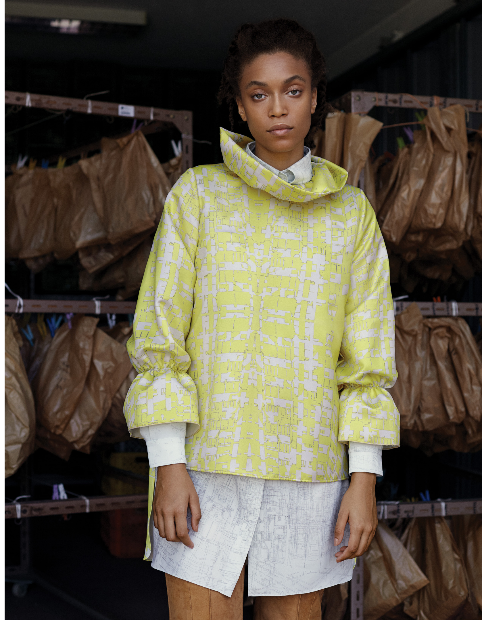
Camisa, BALENCIAGA , na FASHION CLINIC . Na página ao lado: camisola e camisa, ambas RICARDO PRETO . Calças, LONGCHAMP .