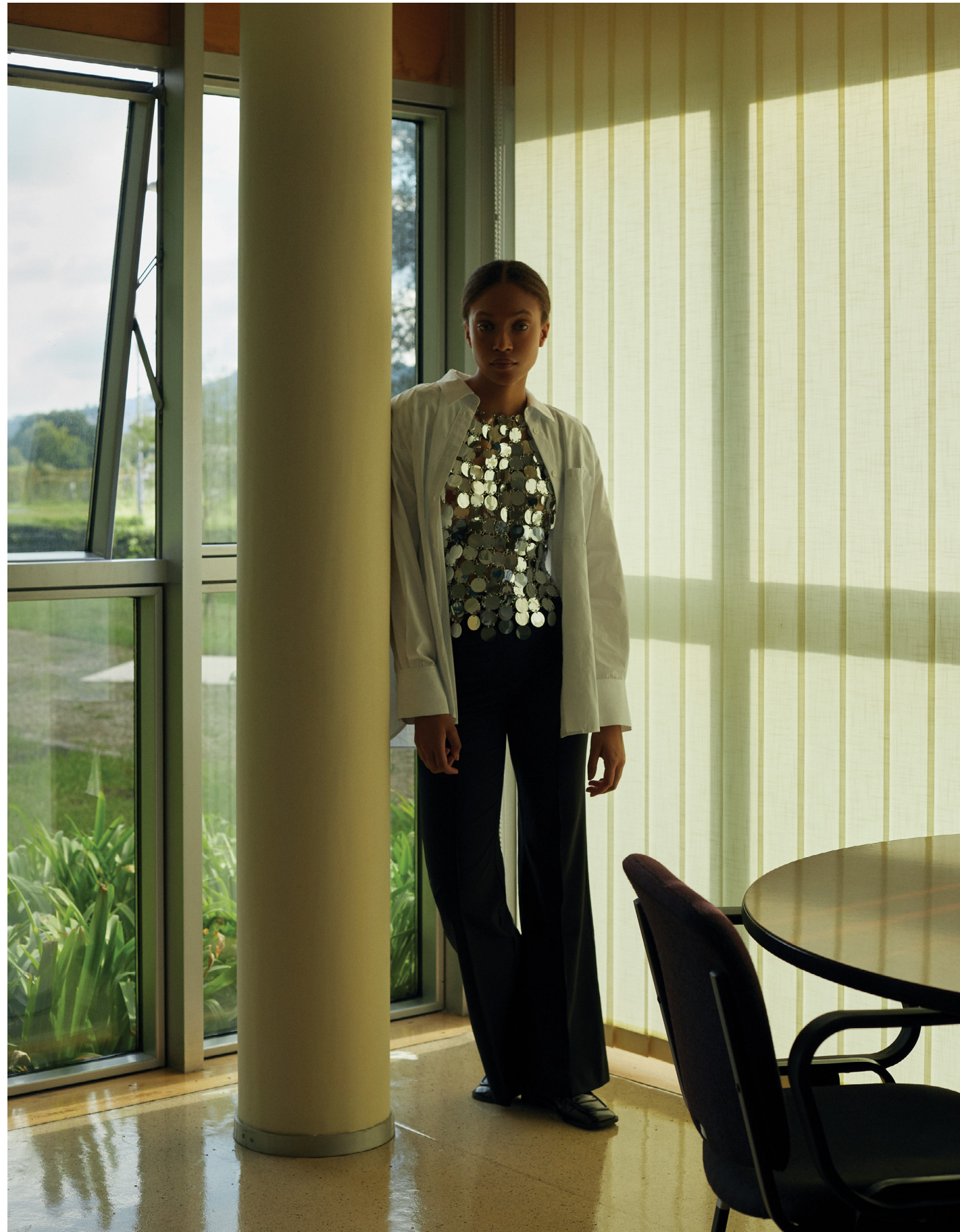
Camisa e calças, ambas PERNILLE X MANGO . Top, PACO RABANNE , na FASHION CLINIC . Sapatos, MANGO . Na página ao lado: colete, hoodie e calções, tudo LOUIS VUITTON .