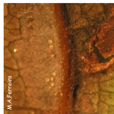
Macho de O. perseae debaixo da teia