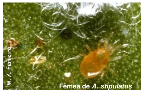
Fêmea de A. stipulatus

É muito importante a remoção das folhas caídas infestadas, por serem focos de disseminação, assim como o conhecimento dos hospedeiros alternativos, tanto para o fitófago, que devem ser eliminados (infestantes e outras plantas sem qualquer interesse), como para os predadores, que devem ser fomentados. Também o incremento da diversidade de cultivares nos pomares poderá ser bom para limitar a praga.