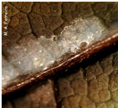
População de O. perseae debaixo de teia densa

Quando as populações são muito grandes, podem ser encontradas colónias na página superior das folhas, nos ramos e em frutos jovens e verificar-se desfoliações. Estas desfoliações aumentam o risco de queimaduras, a queda prematura dos pequenos frutos e a redução do seu tamanho, com perdas na produção.