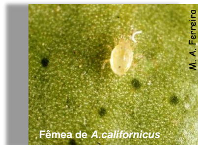
Fêmea de A. californicus