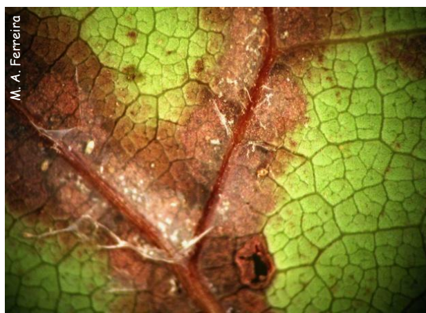
Manchas necróticas e teia originadas por O. perseae