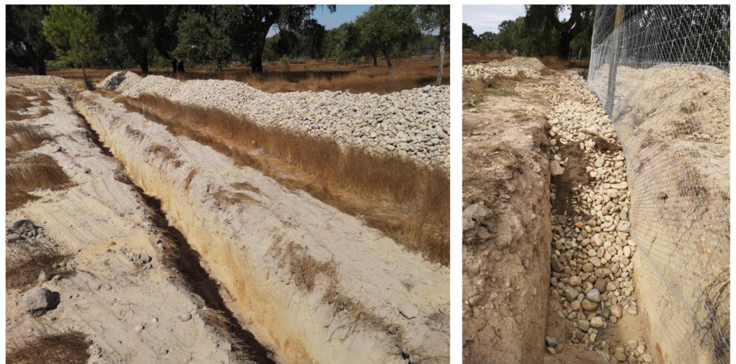
Vala perimetral e enrocamento

Não tendo sido possível cobrir a totalidade do cercado com rede de proteção por questões orçamentais, complementarmente foi criada uma proteção suplementar contra predadores alados, instalando uma grelha de cabos de nylon, agarrada aos postes da cerca perimetral, cruzando-se de forma a impedir e desincentivar o voo de aves de rapina.