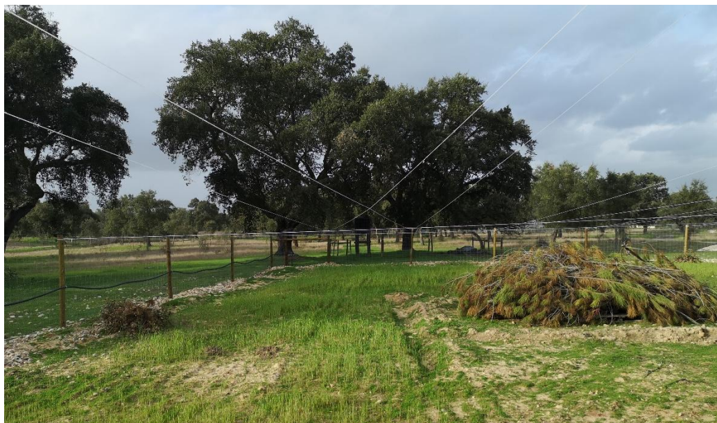
Foram instaladas culturas para alimentação dos coelhos.