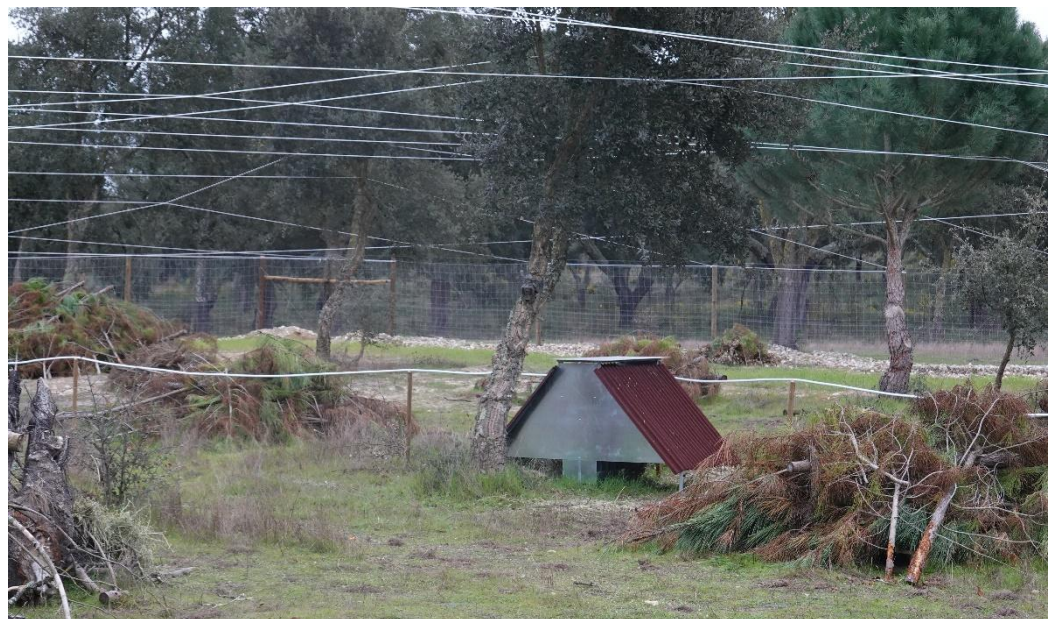
O cercado dispõe de várias unidades onde é disponibilizada comida e água aos coelhos.

Pretendia-se que a população fundadora deste cercado fosse constituída por indivíduos provenientes de núcleos de alta densidade e com elevados níveis de anticorpos, tendo em vista comprovar se a seropositividade alta tem influência na produção do cercado e na capacidade de resistência dos animais, para potenciar ações de repovoamento.