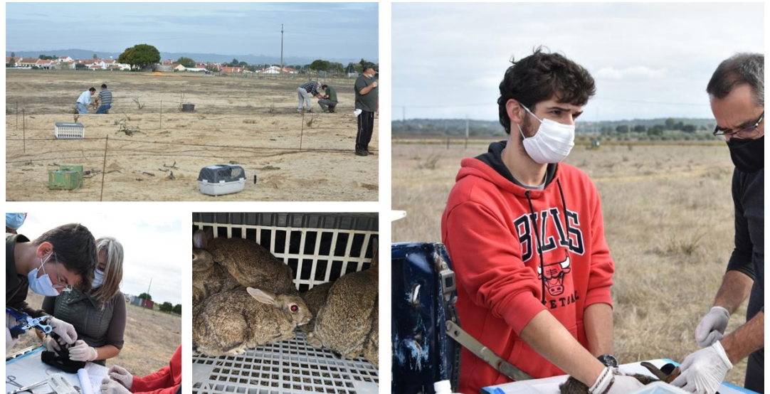
Captura de coelho-bravo para núcleo fundador do cercado da Companhia das Lezírias.

A população fundadora deste cercado foi capturada em local próximo e com solos com características semelhantes, com recurso a credencial emitida pelo ICNF. As capturas foram realizadas sob coordenação da ANPC com o apoio do CIBIO, INIAV, ICNF, DGAV e Companhia das Lezírias.