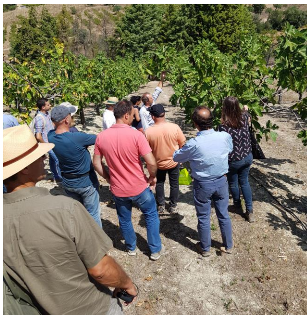
Dia aberto – 31 de agosto 2019