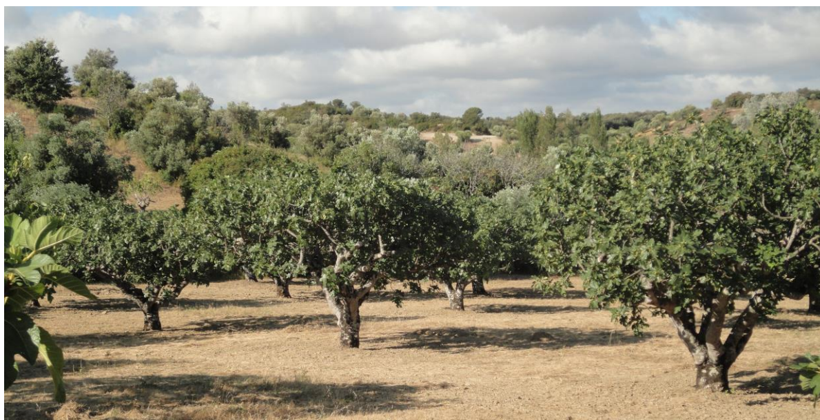
Figueiral tradicional da cultivar ‘Preto de Torres Novas’, em sequeiro