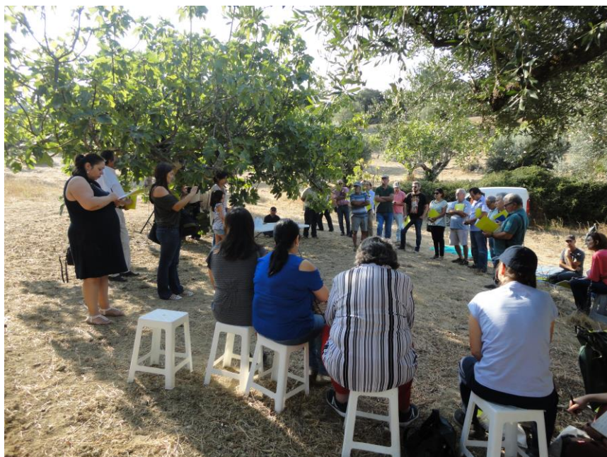
Dia aberto – 15 de setembro 2018