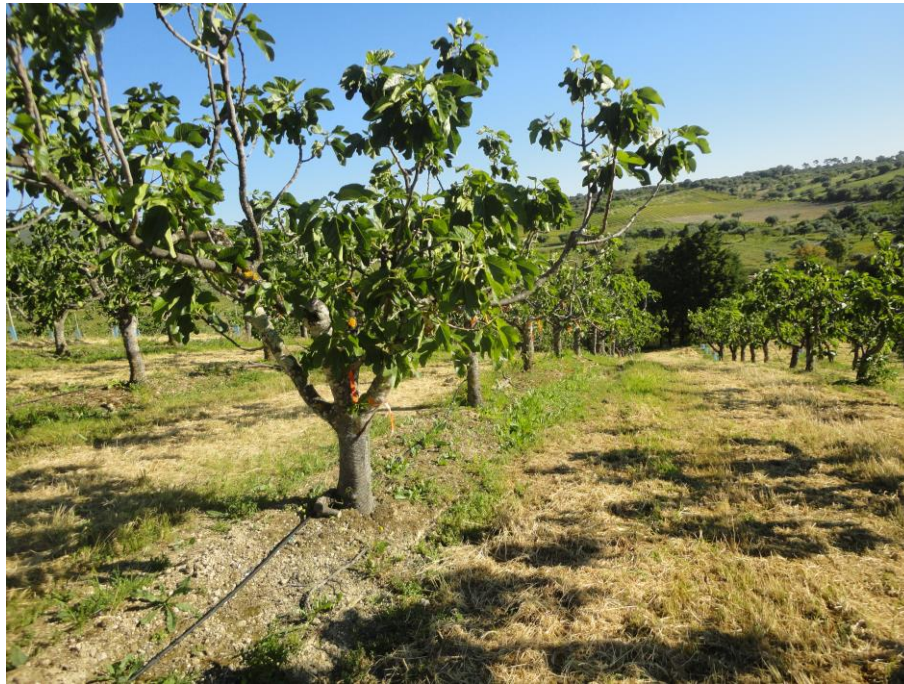
Figueiral da cultivar ‘Pingo de mel’, em regadio.