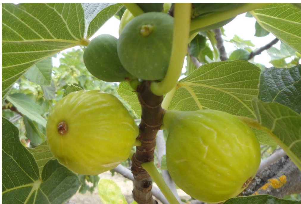
Figos da cultivar 'Pingo de mel'

Pretende-se ainda observar as pragas e as doenças e proceder ao seu controlo em comparação com o não controlo como habitualmente é efetuado pelos produtores. O resultado esperado é o aumento da produção e da qualidade da mesma.